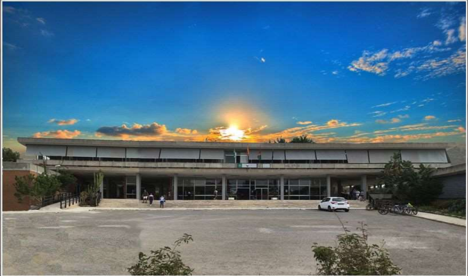
Edificio Principal, Cristaleras y Parada de Autobus